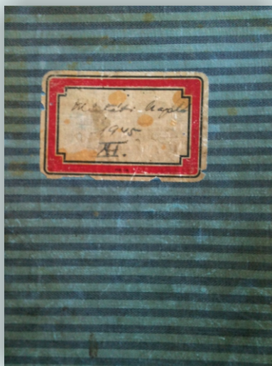
Az eredeti műtéti napló a műtéti bejegyzéssel. A beavatkozást petróleum lámpa fényénél Jung és Petz doktorok végezték.

Boldog Apor Vilmos püspökTestét ideiglenesen a Kármelita templom kriptájába temették. Gyóntatója írásban kérte az egyházmegye kormányzását átvevő káptaláni helynököt, hogy azonnal indítsa meg boldoggá avatását, mert - mint írta - a püspök szent volt. Közben elkészült a vörös márvány szarkofág, Boldogfai Farkas alkotása. 1948. november 24-re volt kitűzve testének ünnepélyes felhozatala a Kármelita templom kriptájából. Az ezt megelőző napon azonban a város és a rendőrség írásban megtiltotta a felhozatalt. Csak 1986. május 23-án lehetett a vértanú püspök testét méltó sírhelyére temetni. Azóta ott pihen és a hívek virággal halmozzák el sírját.